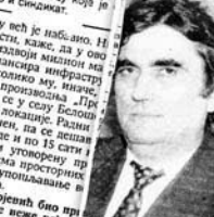
U privatnom preduzeću "Profurj" dobitnik nagrade Privredne komore Vojvodine za kvalitet

Pored toga što je to radi proizvodno privatno preduzeće u Kragujevcu, koje za godišnje poslova, u slučaju da drugim privrednim preduzećima i po tome što je privredno i privatno preduzeće u Kragujevcu koje je novo i sprema.